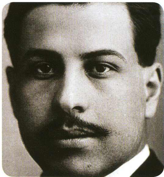
Ramón López Velarde, poeta mexicano

Velarde ha puesto a las letras mexicanas en un destacado lugar a nivel internacional.