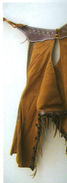
Chaparrera de gamuza con