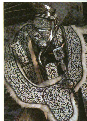
Montura pitiada de

Sus caminos empedrados ante la mirada del visitante, sus calles, los hombres vestidos de charros, por las tradiciones más arraigadas de 150 años, es la talabartería de chaparreras, cinturones que han engalanado a la ciudad. Lo mismo puede decirse de la plata jerezana, cuyas artes dan un aire de distinción a la belleza de las mujeres.